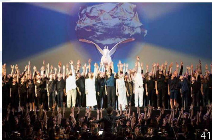
La Flûte enchantée de Mozart au Festival d'opéra de Québec