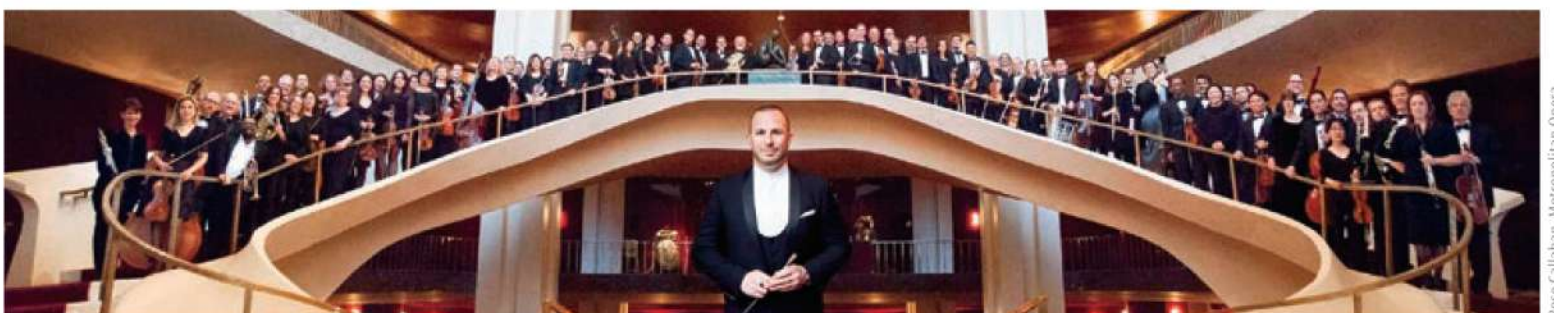
Yannick Nézet-Séguin et l'Orchestre du Metropolitan Opera de New York