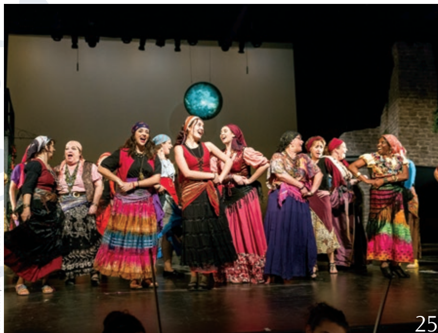
BelleTronche par Bonnalie Brodeur