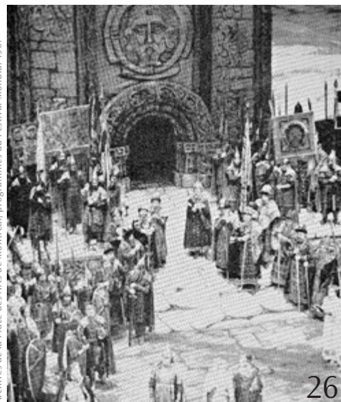
Archives de la Place des Arts de Montréal, programmes du Festival Mondial 1967